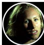
JACQUEMOD Ingrid « La Grande »

Palmarès 2006 : Champion Olympique de Descente Turin 11e Super-G Jeux Olympiques de Turin Coupe du Monde : 8 fois dans les 30 premiers en Descente et en Super-G 20e Classement Final Coupe du Monde de Descente 28e Classement Final Coupe du Monde de Super-G N°1 en descente!