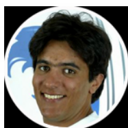
BERTRAND Yannick « Bambou »

Palmarès 2006 : 16e Descente Jeux Olympiques de Turin 21e Géant Jeux Olympiques de Turin Coupe du Monde : 7 fois dans les 15 premières en Géant, Descente et Super-G 21e Classement Final Coupe du Monde de Super-G 21e Classement Final Coupe du Monde de Slalom Géant 25e Classement Général Final Coupe du Monde N°1 en descente et SuperGéant